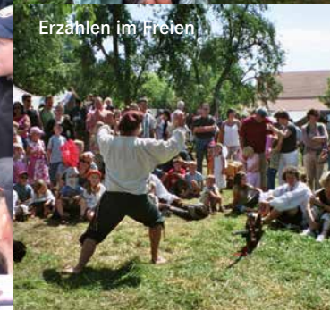
Erzählen im Freien