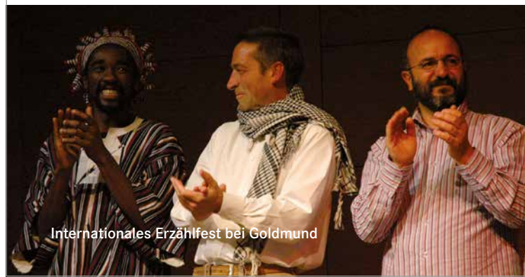
Internationales Erzählfest bei Goldmund

Grafikdesign & Illustration: www.sonjawimmer.com