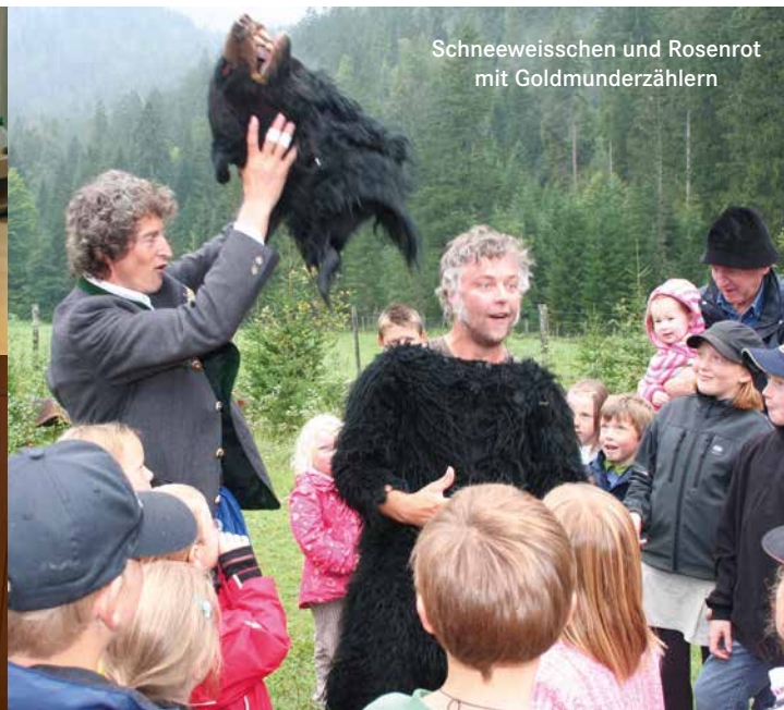
Schneeweißchen und Rosenrot mit Goldmunderzählern