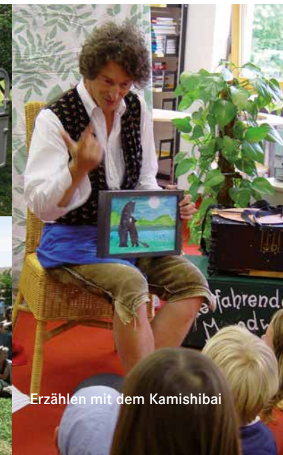
Erzählen mit dem Kamishibai