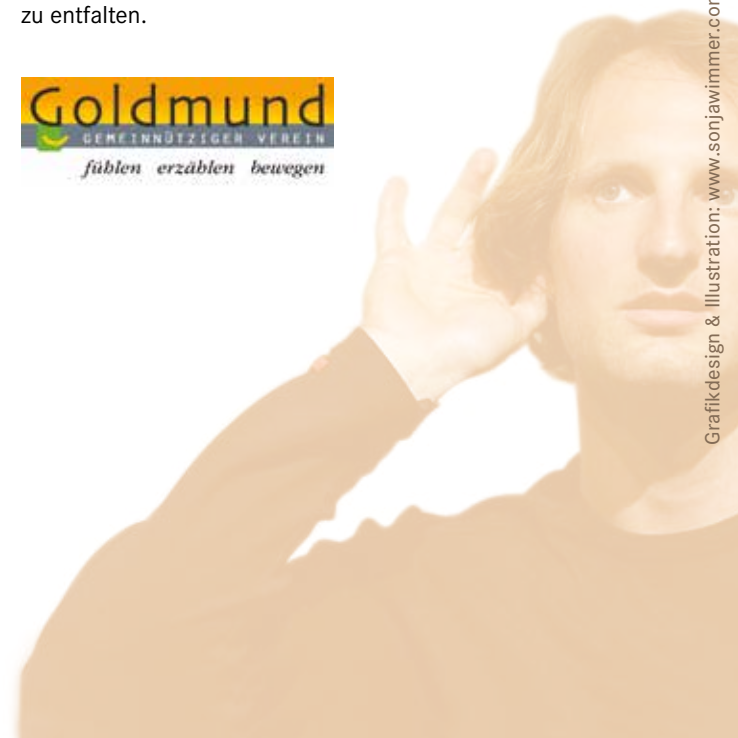
Alle Bilder dieses Prospekts sind im Rahmen von Goldmund-Veranstaltungen entstanden.